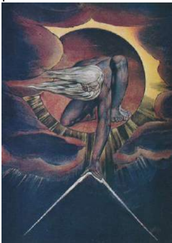
William Blake, Urizen , cover Jerusalem

Blake is de schepper van een wonderlijke wereld en de bedenker van zijn eigen `mythologie'. Dat komt sterk tot uiting in zijn zogenaamde Four Mighty Ones , de vier machtige vermogens, ofwel de Zoas . Daarbij valt vooral de gestalte van Urizen op. Op de voorplaat van zijn gedicht Europa staat Urizen afgebeeld als een oude man, die met een passer het universum scheidt.