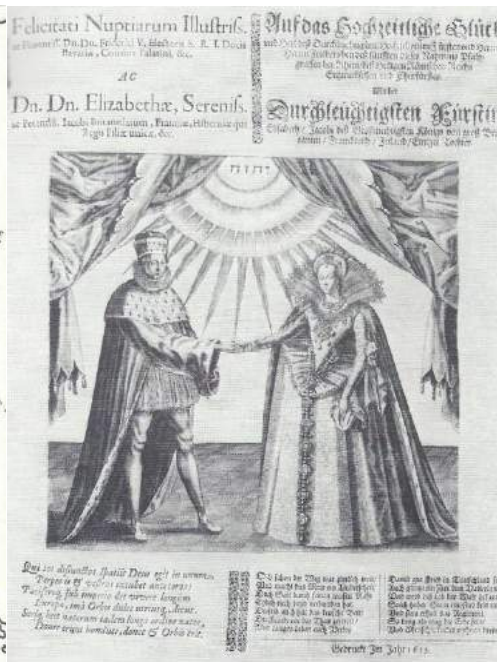
13. Het huwelijk van de keurvorst van de Palts en prinses Elizabeth Duitse prent, 1613.

In 1613 gebeurt er iets opmerkelijks. Jacobus I is als koning van Engeland, als opvolger van Elizabeth. Hij heeft een dochter die ook Elizabeth heet. En die trouwt met keurvorst Frederik V van de Palts, kleinzoon van Willem van Oranje.