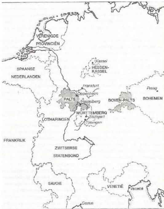
Kaart met de positie van de Palts in de vroege zeventiende eeuw.