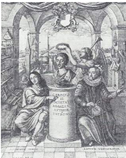
30. De faam van de Royal Society, tinschpingsna bij Themas Sprans History of the Royal Society , Londen, 1667. Ontworpen door John Evelyn, gegraveerd door Wenceslas Hollar

In 1667 richt hij in Amsterdam het 'Collegium Lucis' op, geïnspireerd op de Broederschap van het Rozenkruis, zijn lichtend voorbeeld. Zijn Via Lucis verschijnt in druk en wordt opgedragen aan de Royal Society of London , de Britse academie voor wetenschappen, die in 1660 was opgericht met illustere leden als Christopher Wren, Robert Boyle. John Wilkins en later Samuel Pepys en Isaac Newton.